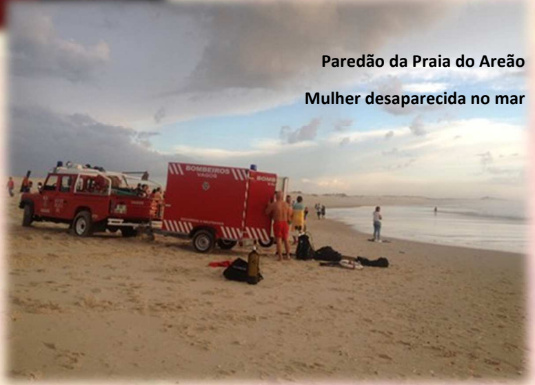
Mulher desaparecida no mar