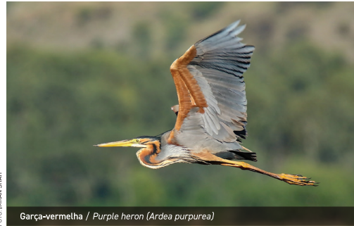
Garça-vermelha / Purple heron (Ardea purpurea)