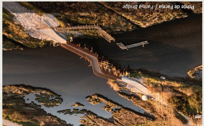
Ponte de Fareja / Fareja Bridge