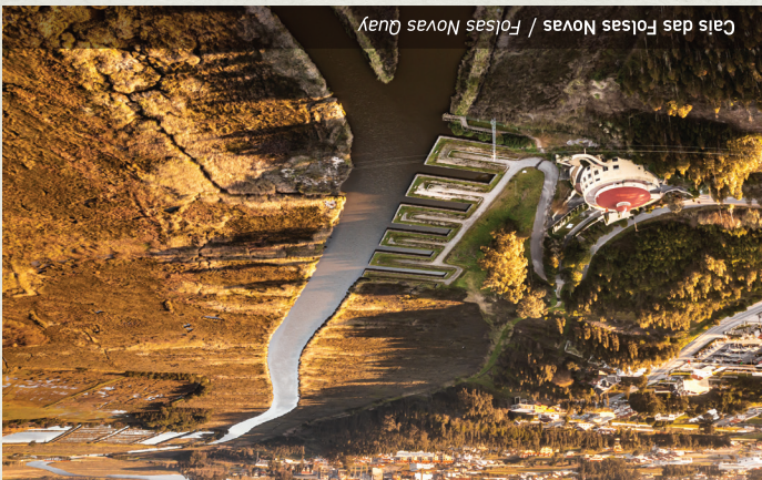
Cais das Folsas Novas / Folsas Novas Quay

Neste percurso, integrado na Zona de Proteção Especial e Zona Especial de Conservação da Ria de Aveiro, da Rede Natura 2000, convidamo-lo a descobrir a história e o património natural e histórico, ao longo do rio Boco. Dos ancestrais moliceiros e a sua atividade à impressionante avifauna, ao longo deste percurso, será convidado a conhecer a forte relação entre a atividade humana e a sustentabilidade deste habitat único e protegido, a Ria de Aveiro. Este é um percurso linear que atravessa o Parque Municipal Quinta do Ega e o leva a percorrer as margens do rio Boco, cruzando o rio pela ponte pedonal de Fareja. Já na outra margem do rio, o percurso acompanha a Grande Rota da Ria de Aveiro, por caminhos rurais, sempre com vistas sobre o rio Boco. Apesar de ser um percurso linear, de ida e volta, funciona também como ligação ao PR4 "Trilho Levadas das Azenhas", permitindo-lhe percorrer um pouco mais deste vale e descobrir o interessante património de levadas e azenhas da Aldeia do Boco. Ao longo de todo o percurso poderá aproveitar para relaxar e fazer observação de algumas espécies de aves e flora únicas deste território.